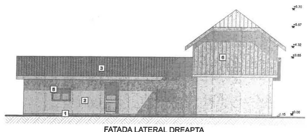
FATADA LATERAL DREAPTA