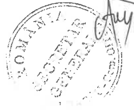
INVENTAR DE COORDONATE "Sistem de Proiectie Stereografice 1970" Teren - 1Cc